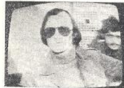
Ο Νίως Μαστοράκης στην εφιαλτική συνέντευξη - αβυσσική, που ζωντάνευε χείρας η ΕΡΤ.

Λίγη ώρα μετά την προβολή της ταινίας, κοιμή-