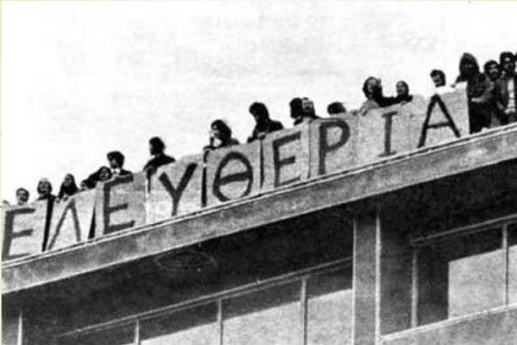
Νομική Σχολή Αθήνας, Φεβρουάριος 1973