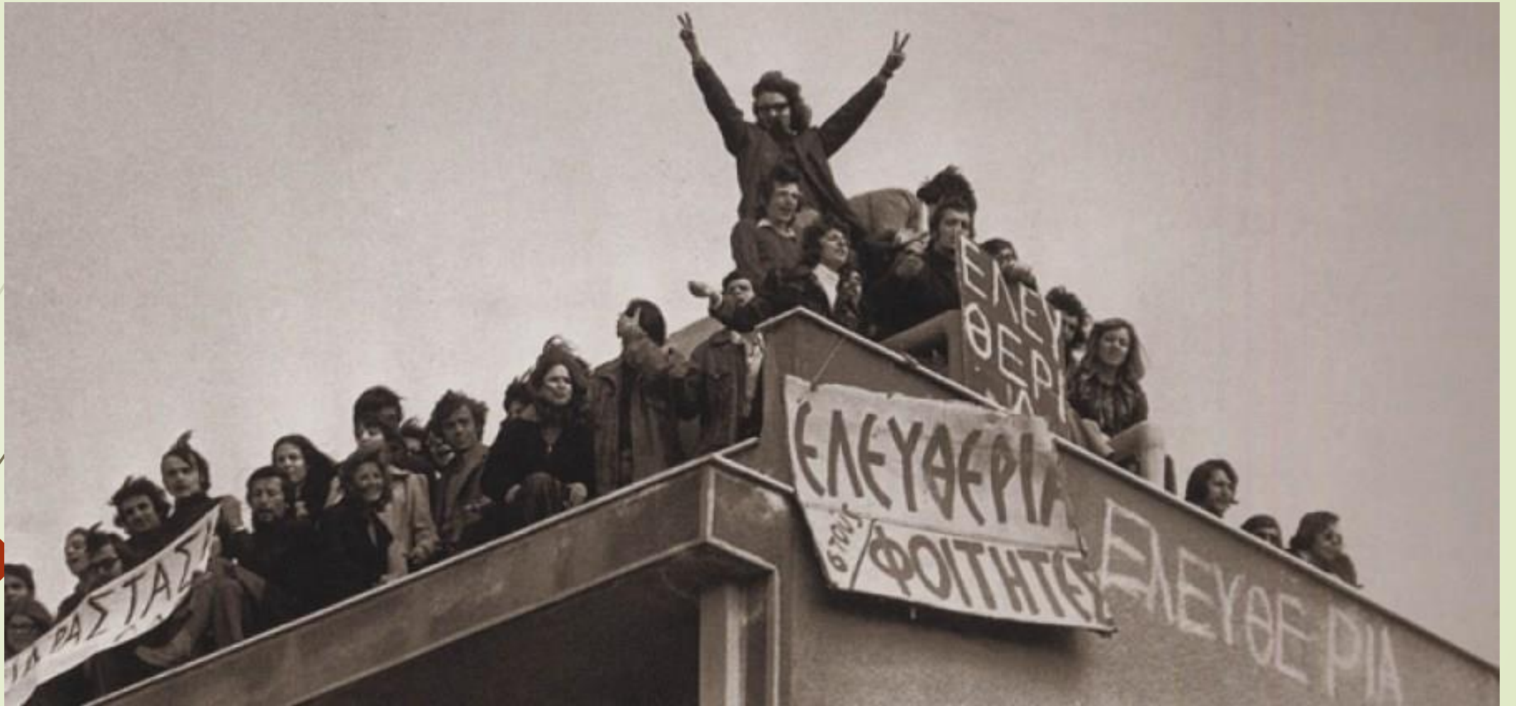
Νομική Σχολή Αθήνας, Φεβρουάριος 1973