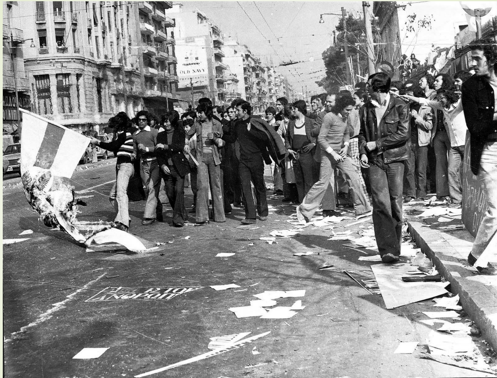
Εθνικό Μετσόβιο Πολυτεχνείο, Νοέμβριος 1973